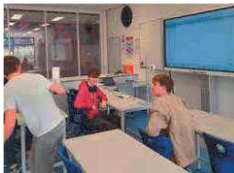
Figuur 1. Grafieken rennen met de ultrasone afstandssensor

Leerlingen krijgen al snel gevoel voor hoe ze moeten lopen, wanneer ze moeten versnellen of omdraaien en waar ze moeten beginnen. Doordat ze steeds even met het team mogen overleggen, ontstaat een goede discussie