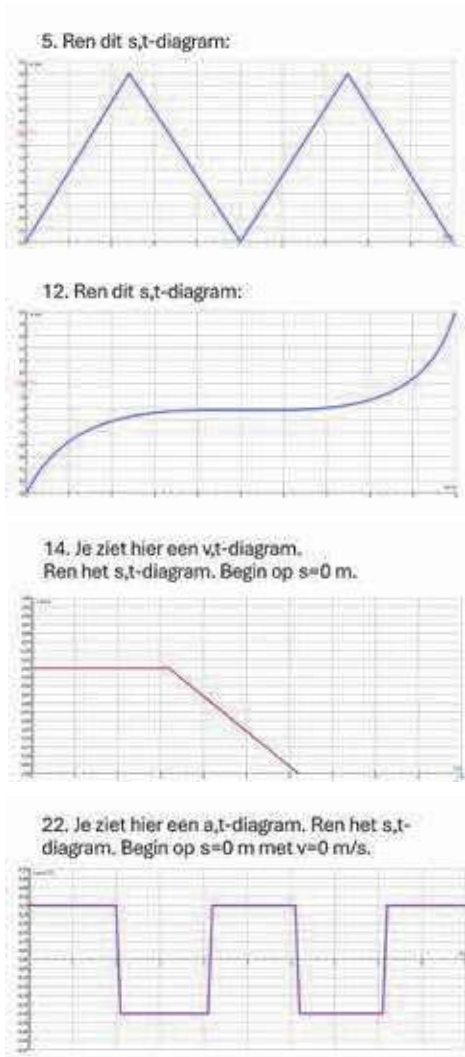
Figuur 2. Vier voorbeelden van grafieken waarvan een plaats,tijd-diagram moet worden gerend

beeld ter afsluiting van het onderwerp. Spreek vooraf af hoeveel rondes worden gedaan, laat het grafieken rennen niet langer dan een halve les uren en koppel een van de gelopen grafieken aan uitleg of een voorbeeldopgave. De werkvorm is interactief, dus zorg dat teams zo zitten dat ze kunnen overleggen. Leerlingen zien in dat deze activiteit leerzaam is om de steilheid en oppervlakte van grafieken beter te begrijpen en dat het, ondanks het competitie-element, niet erg is om fouten te maken. Veel leerlingen geven aan het competitie-element wel te waarderen, zolang vooraf maar duidelijk wordt afgesproken wanneer een gelopen grafiek goed is.